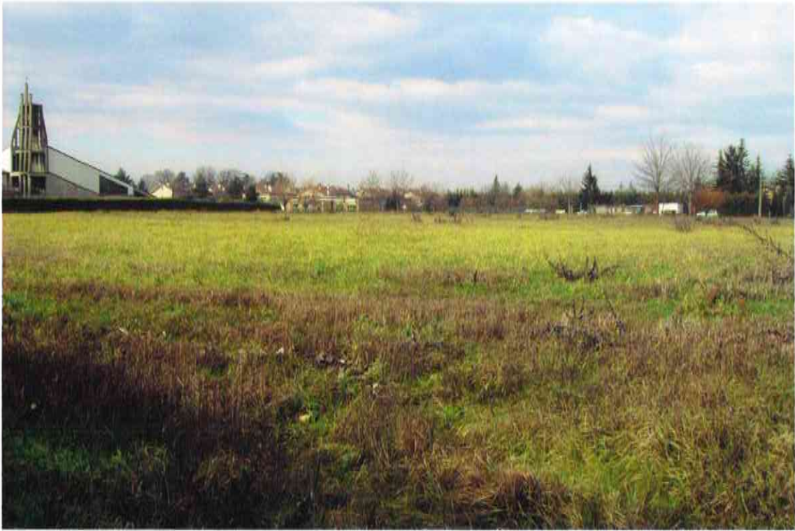
ORIENTAMENTO VERSO NORD-OVEST