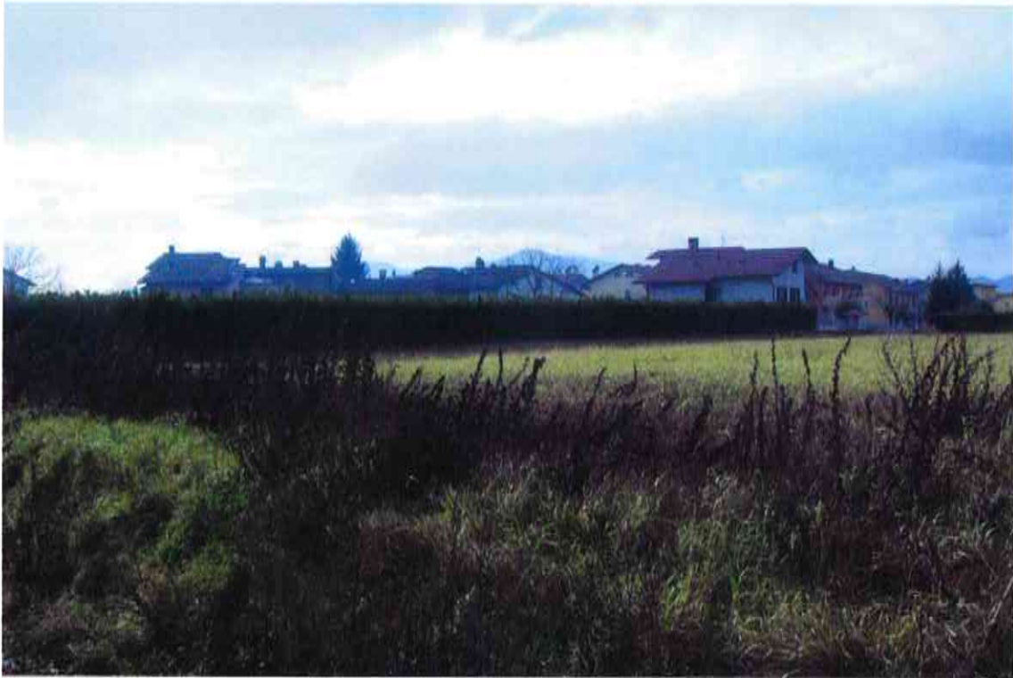
ORIENTAMENTO VERSO SUD-OVEST