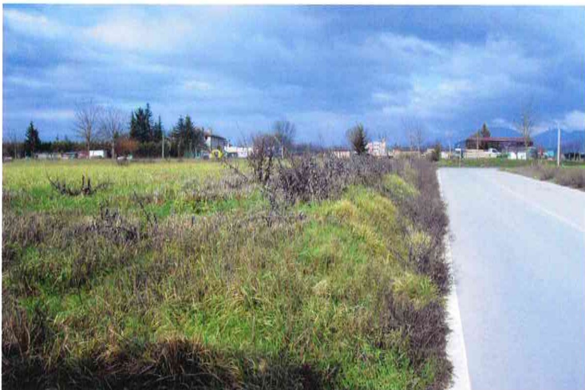
LATO EST (LUNGOSTRADA)