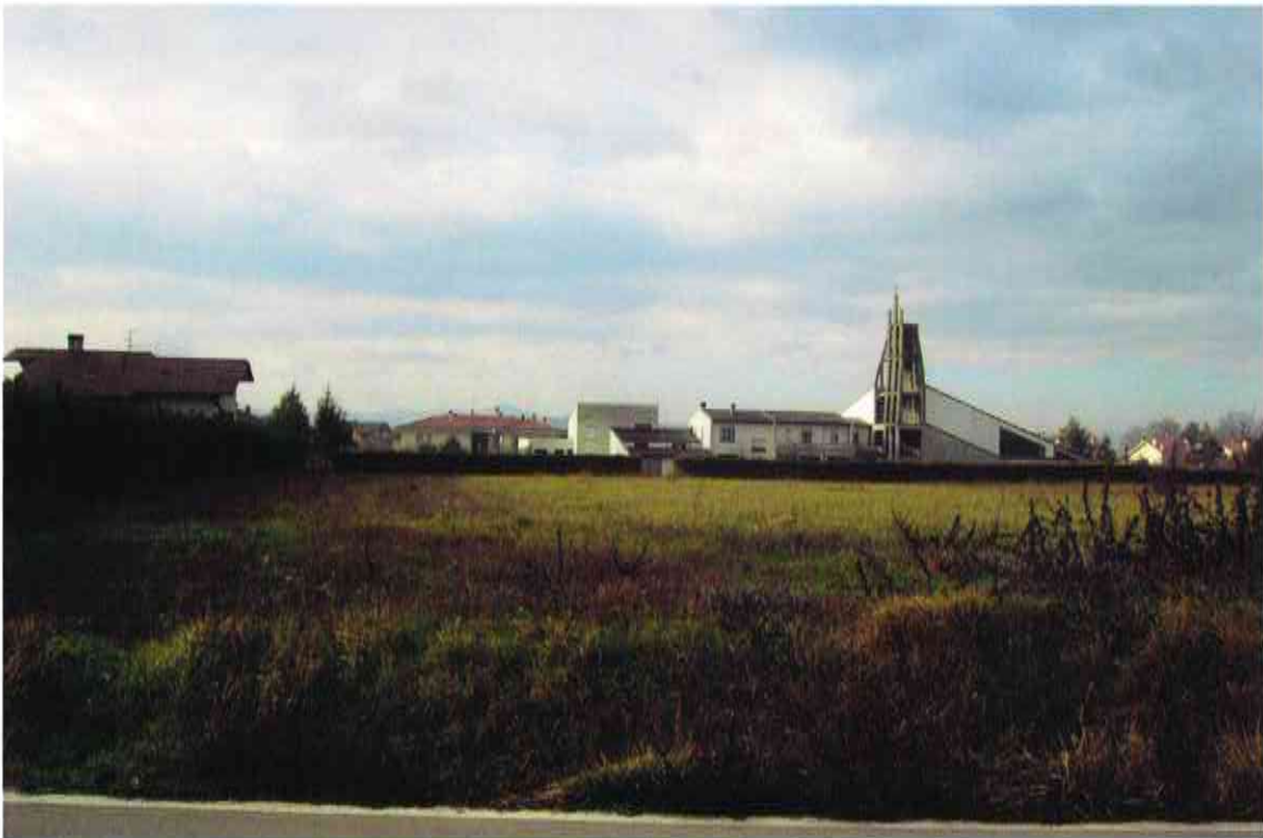
ORIENTAMENTO VERSO OVEST